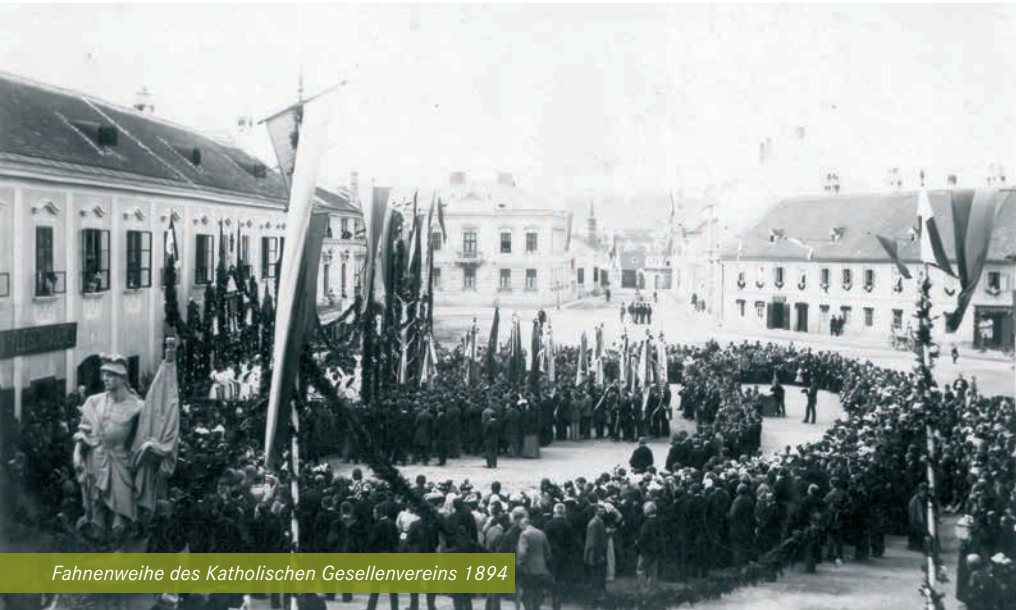
Fahnenweihe des Katholischen Gesellenvereins 1894